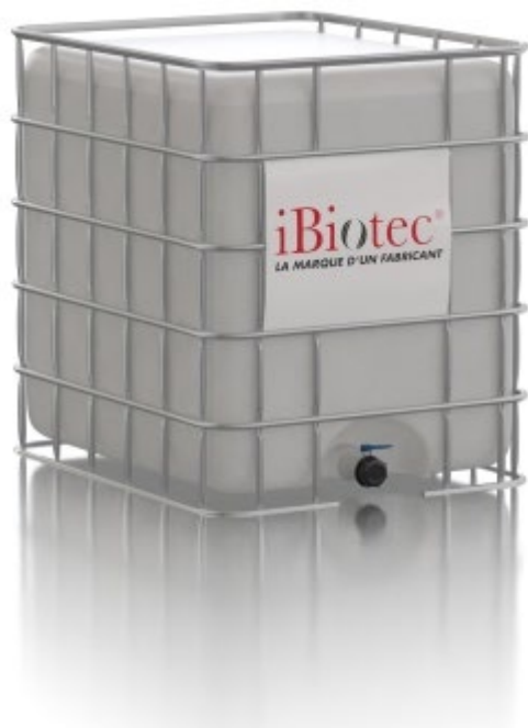
IBC-beholder 1000 L